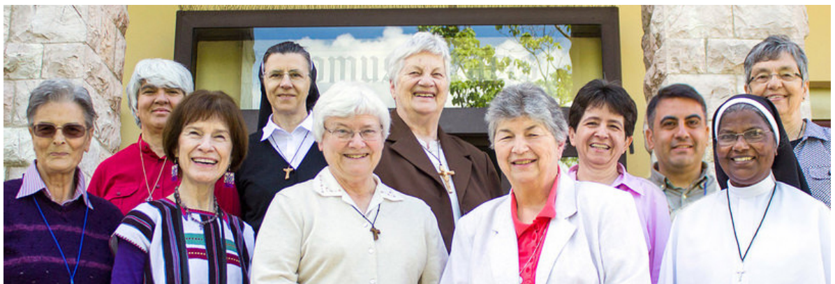
General Assembly Facilitator, Assembly Secretary, Presenter, Staff, and 2013-2017 IFC-TOR Council

La congrégation a encore des problèmes démographiques, qui affectent leur façon d'aller "dans le monde". Elles ont encore du mal à définir leur mission, mais elles ont besoin de parler des valeurs de leurs fondateurs. Elle a conclu en disant qu'elles vivent en fraternité avec ceux qu'elles servent, et que personne n'est pauvre au point de n'avoir rien à partager. Elle a terminé par une question : vivons-nous vraiment l'humilité ou bien avons-nous l'illusion de la vivre? Nous devons permettre aux autres de laver nos pieds car c'est pour nous un besoin vital.