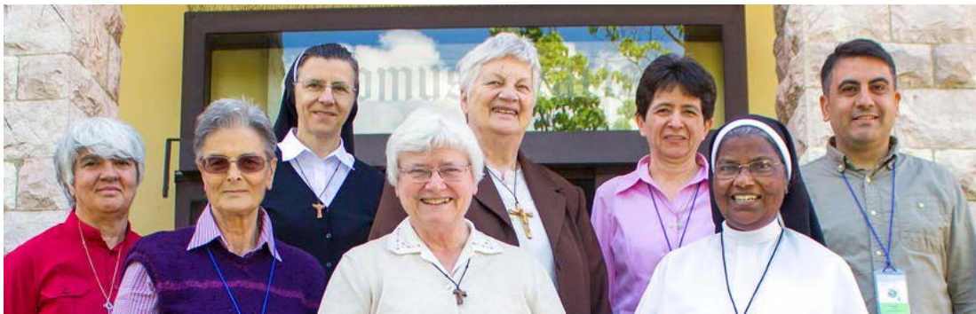
Outgoing IFC-TOR Council and Staff

L'article #18 de notre Règle nous rappelle que nous sommes "des pauvres... à qui le Seigneur a donné la grâce de servir ou de travailler." Nous reconnaissons que chaque membre de notre congrégation a une "grâce" spéciale – nous l'appelons un talent ou un don – pour la construction du Royaume de Dieu. Et, en tant que responsables, nous prenons en considération les conditions requises pour assurer une formation permanente et un enrichissement de ces dons pour la mission plus grande consistant à prendre soin du Corps du Christ.