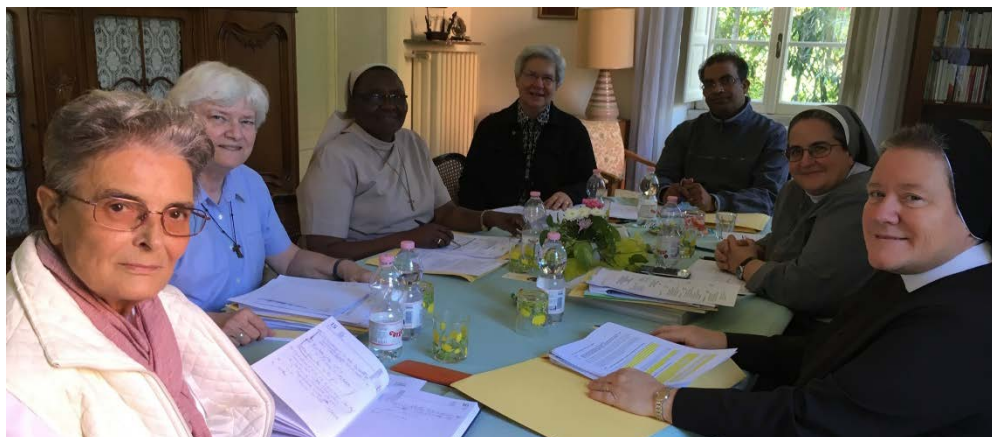
New elected IFC-TOR Council and secretary at work